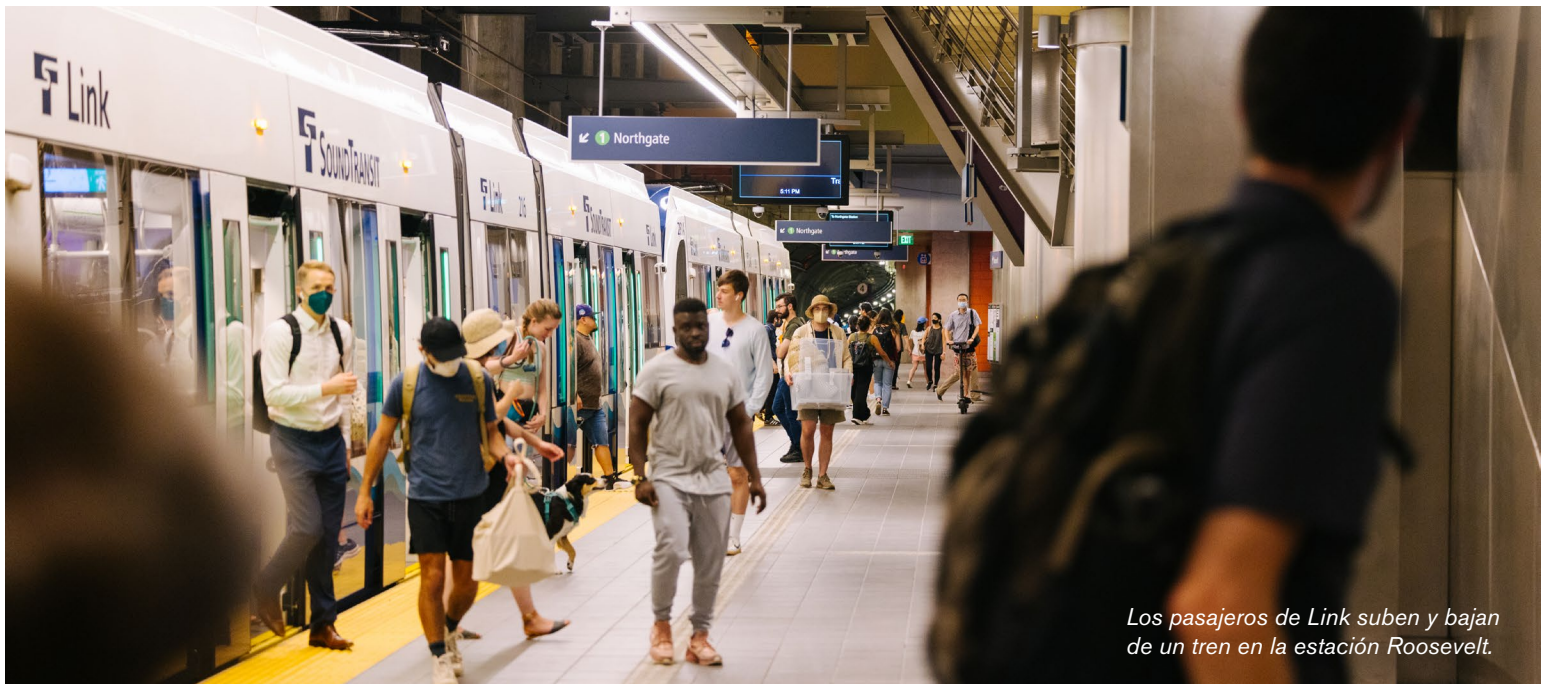
Los pasajeros de Link suben y bajan de un tren en la estación Roosevelt.