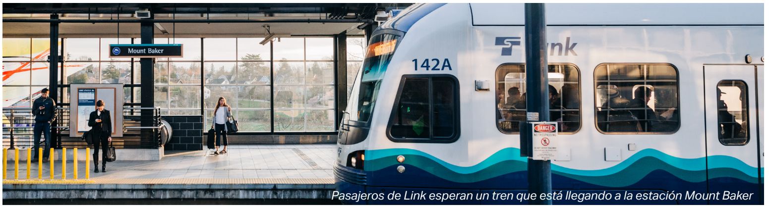
Pasajeros de Link esperan un tren que está llegando a la estación Mount Baker