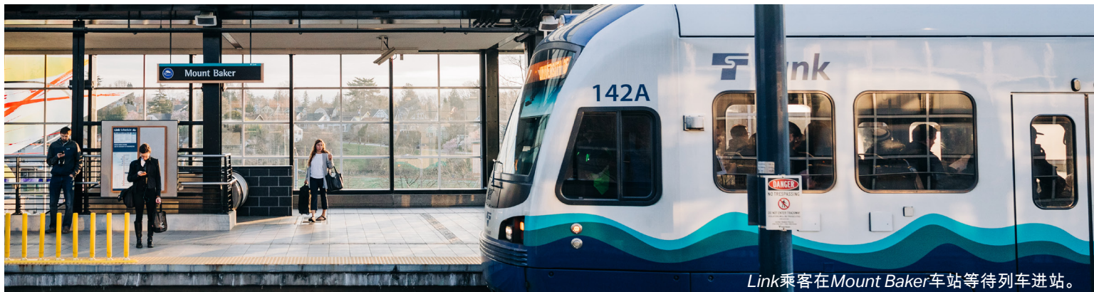
Link乘客在Mount Baker车站等待列车进站。