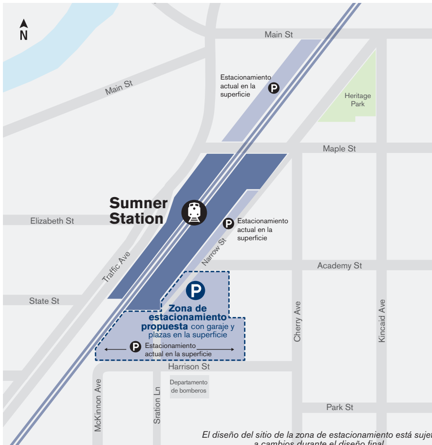
El diseño del sitio de la zona de estacionamiento está sujeto a cambios durante el diseño final.